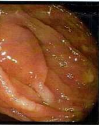
גסטרו תמונה - 2